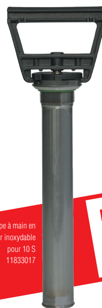
Pompe à main en acier inoxydable pour 10 S 11833017