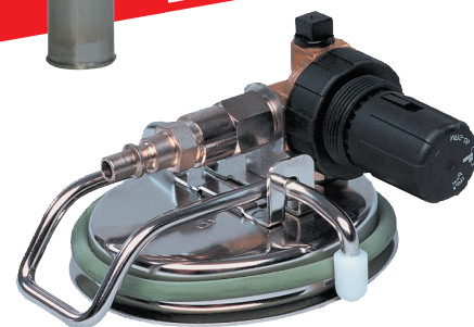
Couvercle avec réducteur de pression pour 10 S, 20 S, 20 SH 11647105