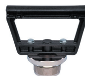
Fermeture avec poignée 5 S, 10 S 11380601