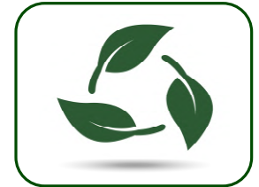
Formulé sans synergiste (PBO) de synthèse

SOLU.FR TOUTPOURLESNUISIBLES.COM PENNTYBIO.COM