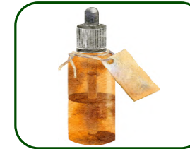
Huiles essentiels végétales