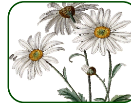
Pyréthrines issues de la fleur Chrysanthemum cinerariaefolium